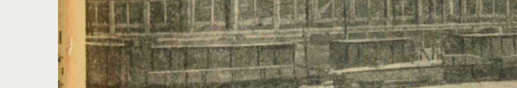
Немецкие зенитки, захваченные нашими войсками на станции Изюм.

В заключение на совещании присутствовали секретарь ЦК ВКП(б) М. И. Калинин, секретарь ЦК ВКП(б) М. И. Калинин, секретарь ЦК ВКП(б) М. И. Калинин.